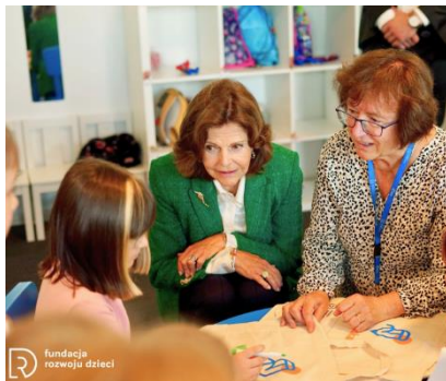
Wizyta szwedzkiej królowej Sofii....