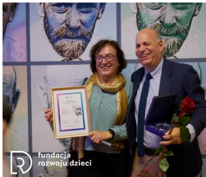
FRD otrzymała Nagrodę im. J. Korczaka